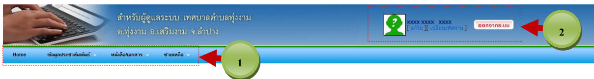
รูปที่ 1.1 หน้าจอเข้าสู่ระบบ

ยินดีต้อนรับเข้าสู่ระบบข่าวประชาสัมพันธ์